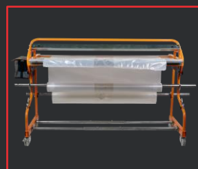
SOUDEUSE MANUELLE MULTICOVER 955