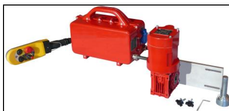
Système d'avance automatique en option ( pas disponible sur la CE200 )