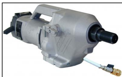
Moteur pour Ø 500 mm. Nous consulter.

La colonne de guidage en aluminium est légère, orientable et munie de roues pour un déplacement aisé. La hauteur de colonne permet une course de 700 mm (sauf CE200). Il peut être fixé par chevillage ou par ventouse (en option). De nombreux accessoires peuvent s'adapter, tels que récupérateur d'eau, support pour fixation sur échafaudages, etc.