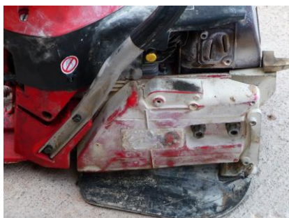
VOTRE MATERIEL AVANT