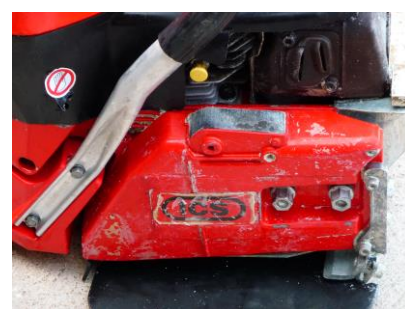
résultat après 20 minutes