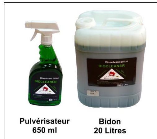
Pulvérisateur 650 ml