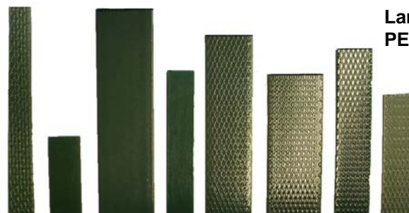
Largeurs de feuilard PET disponibles

Impression en 1 couleur ( nous consulter )